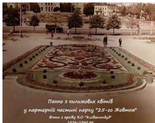
Рис. 12. Квіткові панно з орнаментальними мотивами та візерунками 1956–1980 рр.