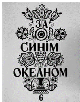
Рис. 5 а. "За синім океаном" (А. Салабай)