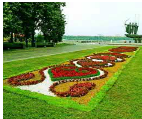
Рис. 9. Орнамент Київської Русі (Наводницький парк м. Київ)