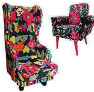
Рис. 3. М'які меблі в етнічному стилі (М. Серветник)