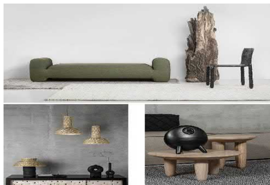
Рис. 4. Колекція "Faina" (В. Якуш)