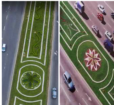
Рис. 7. Фрагмент розподільчого партеру пл. Перемоги (2018)