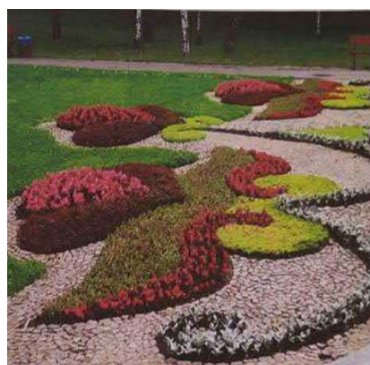
Рис. 8 б. Партер у парку