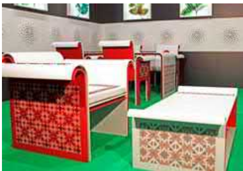
Рис. 2. Колекція меблів "Українські візерунки" (Я. Галан)