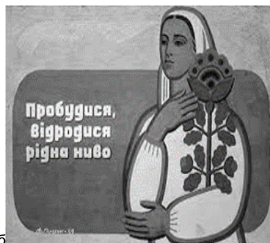
Рис. 5 б. Плакат "Пробудися, відродися, рідна ниво". Київ, 1989 (Ф. Глушук)