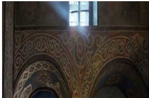
Рис. 11. Панно біля Кирилівської церкви та фрагмент орнаменту