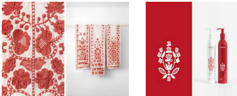
Рис. 1. Brun'ka (Ю. Гуцуляк)