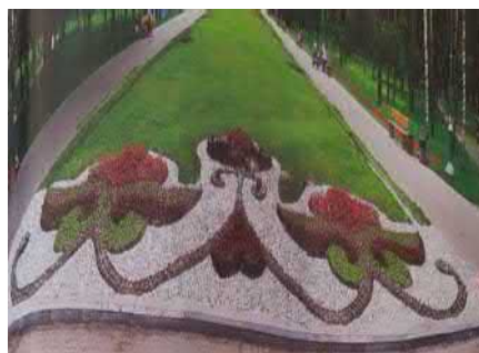
Рис. 14. Фрески та квітова композиція