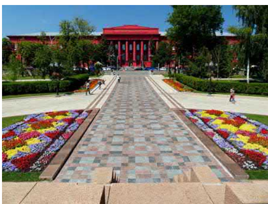
Рис. 8 а. Композиція у парку Т. Шевченка