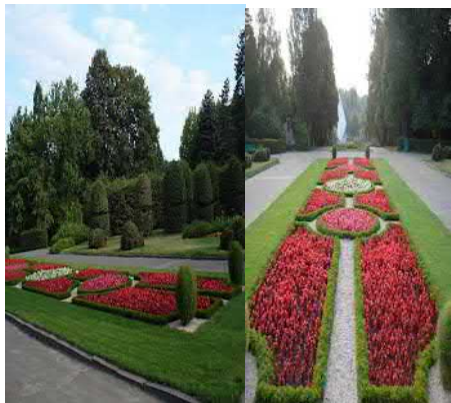
Рис. 6. Партер у Ботанічному саду